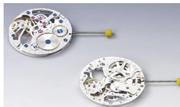
Nr. 2 squelette in in rhodium, antrazit oder vergoldet