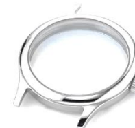
Nr. 1 Stahl poliert