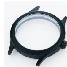
Nr. 2 Stahl geschwärzt