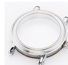
Nr. 3 Breguet style